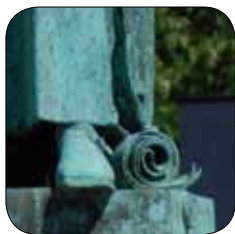
Martin Luther: Påven bär Anti-Krists kännetecken.

kapitel 20, verserna 3-17), och de har också ändrat på vilodagen. Detta är den största förfälskningen i historien. Påven är en falsk representant för Jesus, och Luther och reformatörerna hade rätt, då de framställde Påven och det påvliga systemet som Anti-Krist. Påven står för något annat, än det Kristus står för. Jesus var medmänniska och tjänare. Han hade inget, som Han kunde luta huvudet mot, men Påven reser runt i all sin prakt och uppträder som härskare.